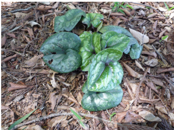
タマノカンアオイ汁守神社