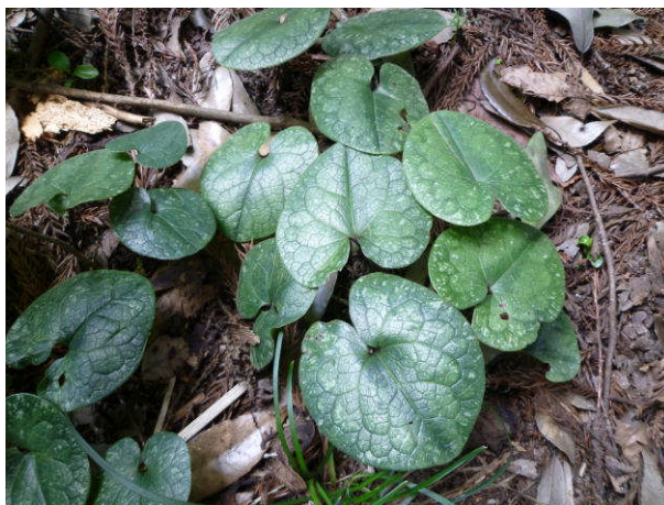
タマノカンアオイ箭柄八幡宮