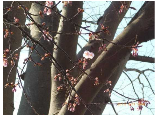
■ 2月23日寒桜咲き出し