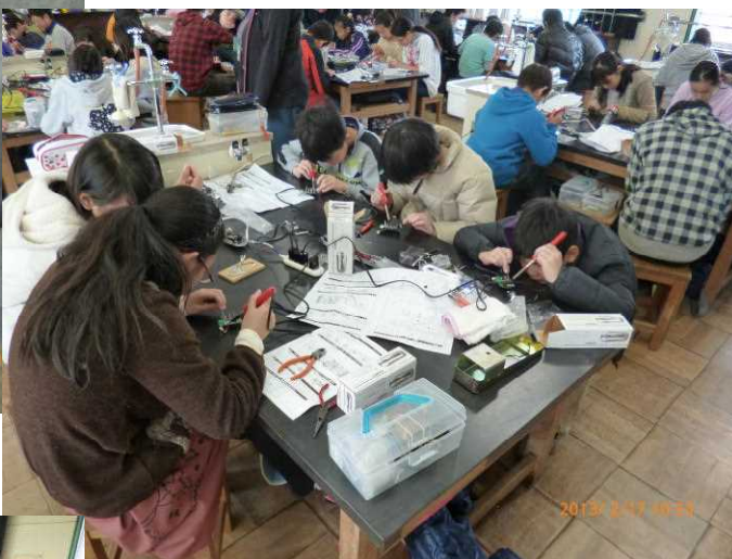
こちらはWIND LIGHT ↓