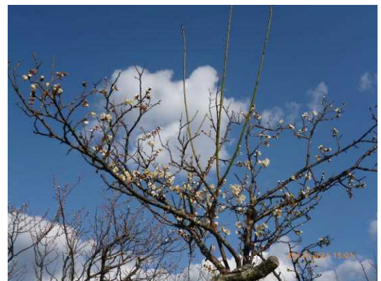
■ 2月21日田浦梅林咲き出し