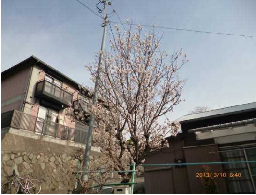
■ 3月10日コヒガンザクラ