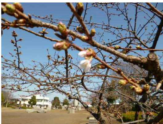
■ 3月5日玉縄桜咲き出し