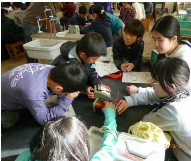
←まずは電気の実験！

2月17日（日）に湘南台小学校で行いました。 新入団員は「はんだごて」、そのほかの団員は「WIND LIGHT」を作りました。うまくできましたか？