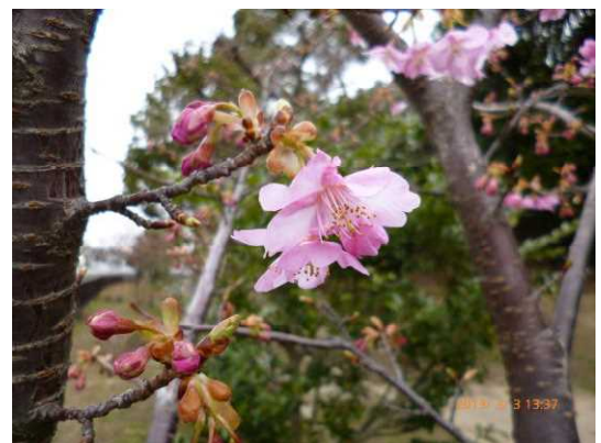
■ 3月3日河津桜咲き出し