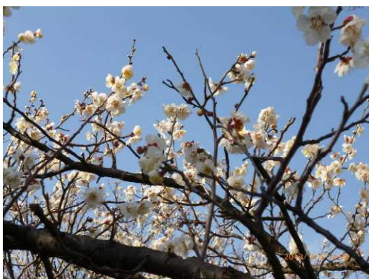
■ 3月5日普通品種の梅見頃