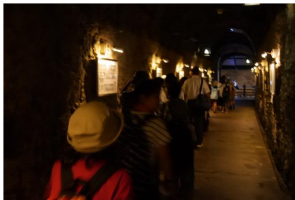
■岩屋の見学 波の力作った洞窟「海食洞」