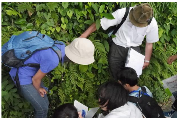
■裏参道でシダの観察