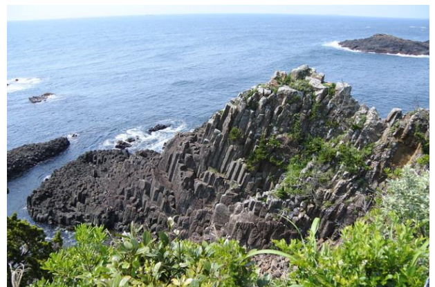
■伊豆は柱状節理の博物館！