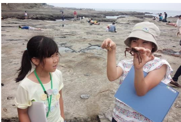
■稚児ヶ淵で生き物探し かにを捕まえた