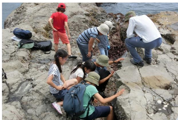
■稚児ヶ淵で磯の生き物の観察