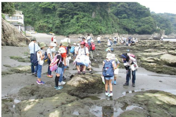
■西浦海岸は川からの土砂が多い