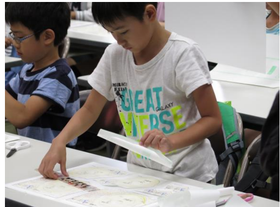
■ 先に貼るのは・・・