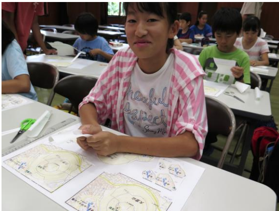
■ 今年は枚数が多い・・・