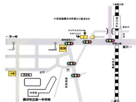
第一中学校への地図