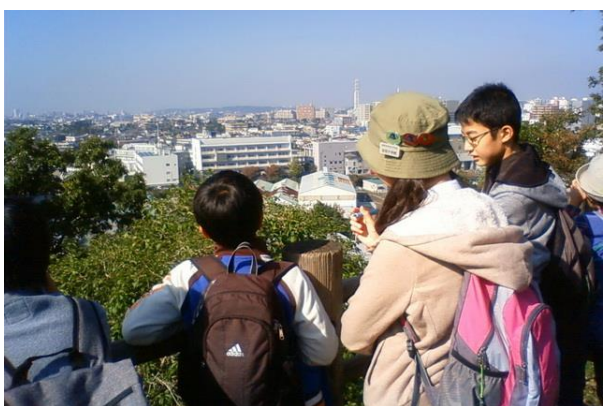
■展望台からのながめ