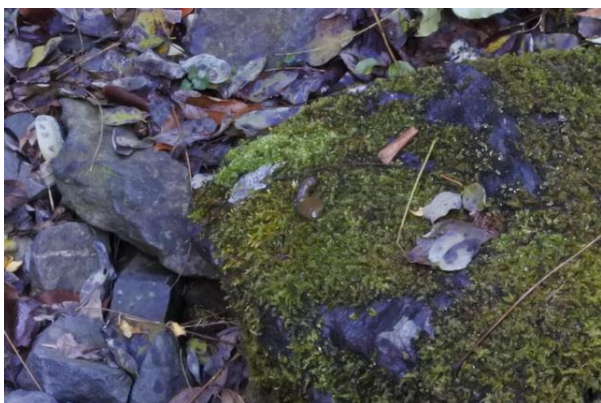
■イタチの糞を観察。