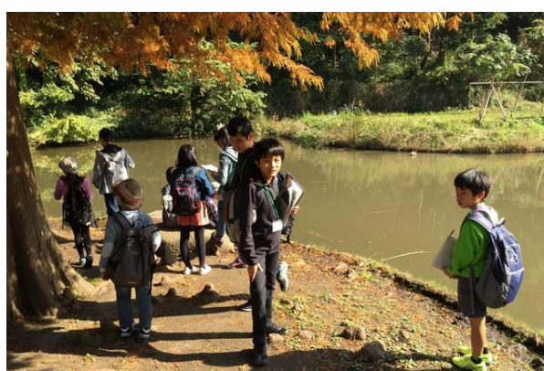
■メタセコイアの紅葉がきれいでした