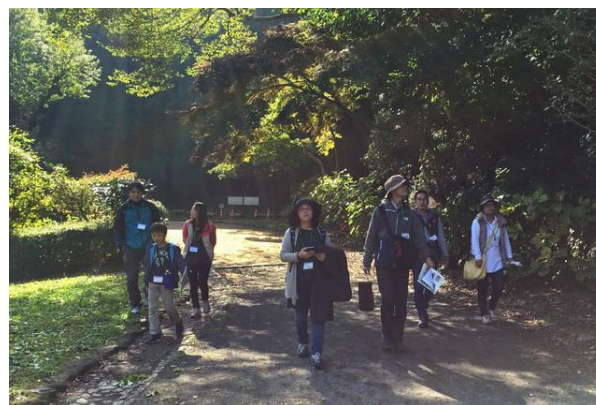
■保護者チームの観察会も充実でした