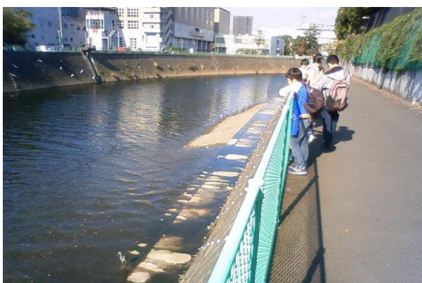
■境川を観察しながら歩く