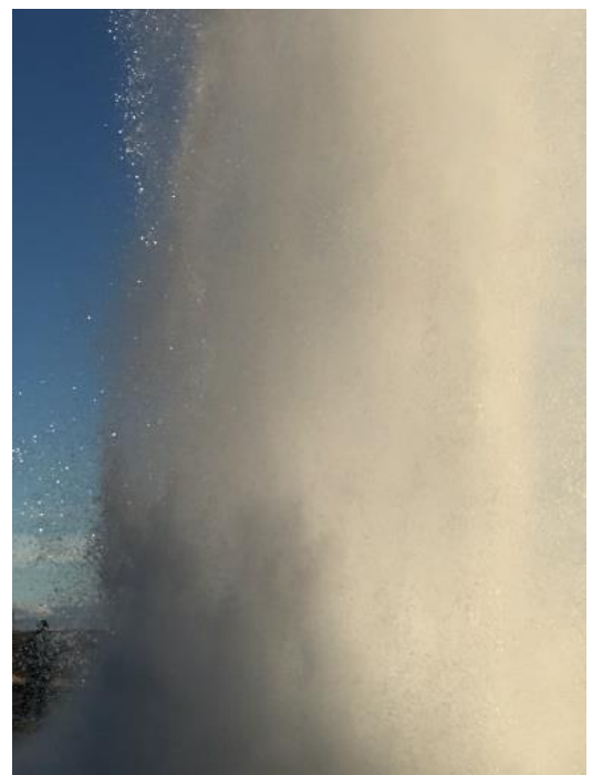
ストロククル間欠泉。 湯温 80°C~100°C。数分に1度吹き上がる。