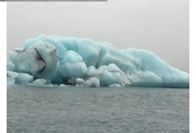
ヨークルスアロンの氷河湖の氷。 強風のためボートクルーズは中止になったそう。 それくらい風が強い日が多いようです。