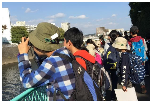
■ユリカモメやアオサギが観察できました