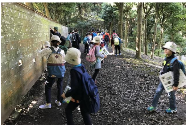
■大池で野鳥の登場を待つ