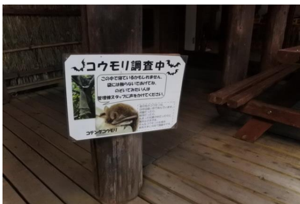
■様々な生き物の調査をしています。