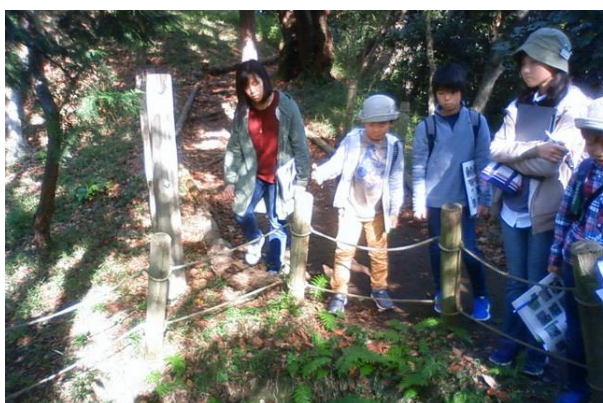
■新林公園のハイキングコース