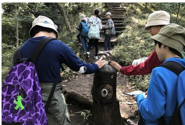
■班ごとに観察しながら歩きます