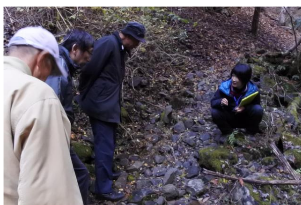
■宿泊先のスタッフは自然ガイドです。