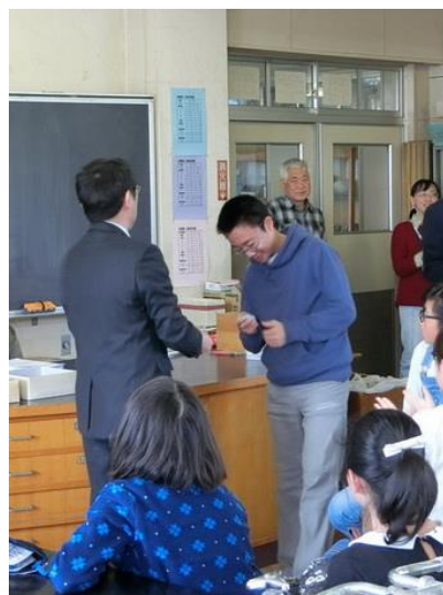
■皆勤賞おめでとう