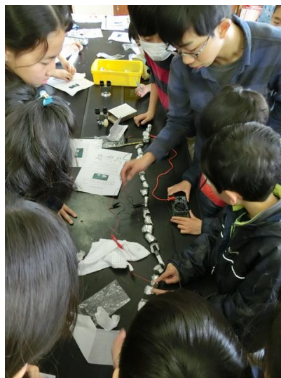
■つなげたら電気が強くなる？