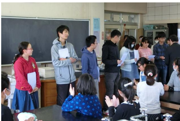
■卒団する中学3年生