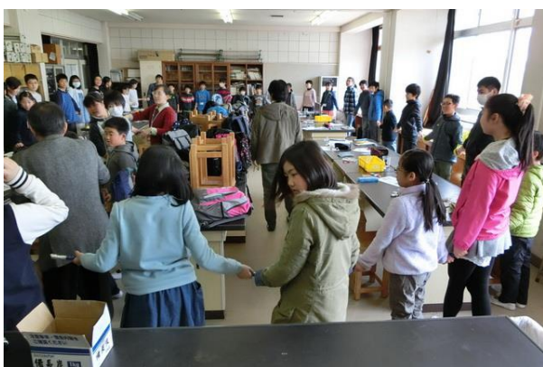
■備長炭人間電池を全員でチャレンジ