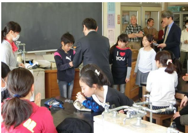
■団長より一人ひとりに