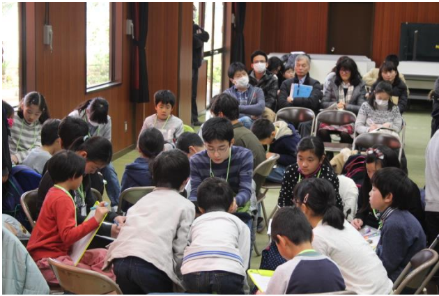
◇雑草を食べる会打ち合わせ どんなメニューにしようかな。