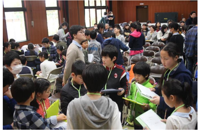
◇雑草を食べる会打ち合わせ 持ち物の分担を班長中心に。