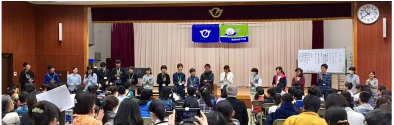
◇班長・副班長紹介 たよりになる班長・副班長に。一言ずつあいさつしてもらいました。