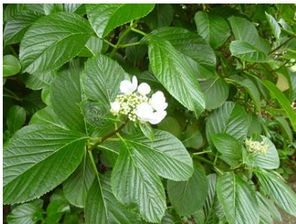
⑤ガクアジサイ、新林公園