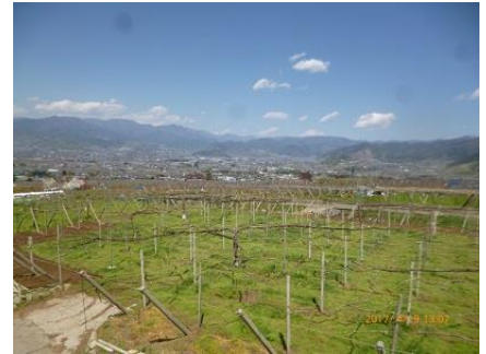
①釈迦堂桃畑、大縄文遺跡

早川の出入り口にあるクラフトパークにも立ち寄りしました。広い公園のあちこちに展示館や美術館、実習室や道の駅もあります。切り絵展を見て「現代切り絵」のすばらしさに魅了されました。ひと月遅れで咲く満開のバラが、軽井沢のような高涼地の夏を演出します。高速バスの便もあり、安価な家族旅行にも適した所と思います。