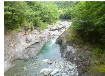
③少し上流の早川、右が東