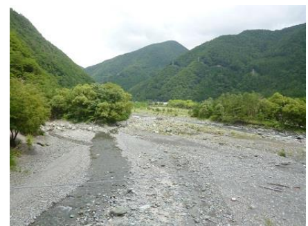
②つり橋から早川、右が東