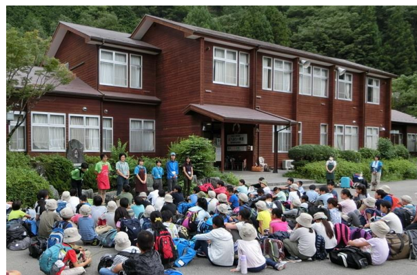
■ ヘルシー美里スタッフにお礼の挨拶