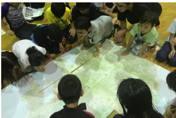
■希望者講座 20万分の1地勢図をつなげて