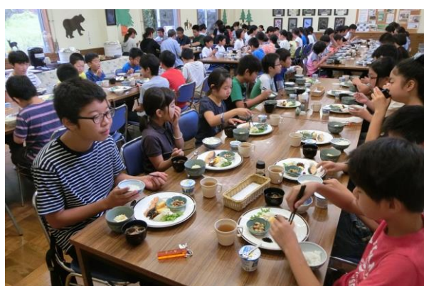
■ヘルシー美里の食事