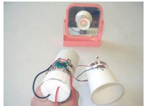
■鏡を使った光通信の実験

実はこの光通信、現代の高度情報化時代に非常に重要な役割を担っています。工作と実験を通じてそのようなことにも理解を深めましょう。