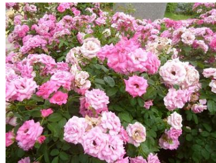
⑦クラフトパークのバラ