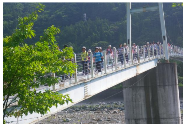
■野鳥公園へ向かう吊り橋