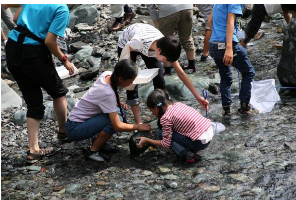
■水生昆虫さがしに夢中です