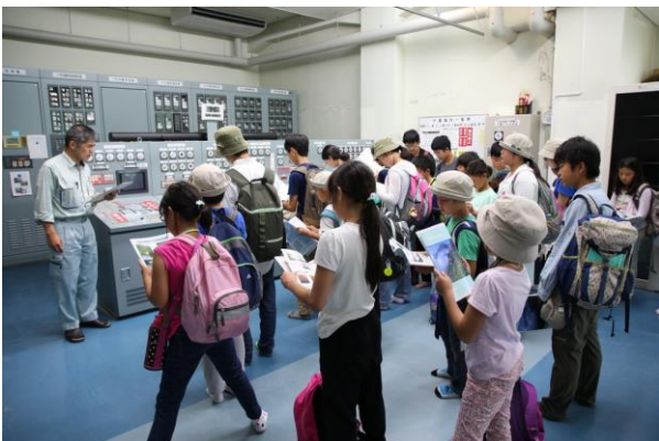
■ 発電所見学 制御盤の前で説明