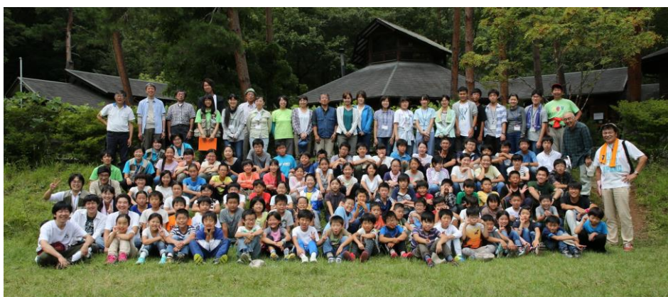
■ 集合写真 2日目昼食後 ヘルシー美里のみなさんとともに