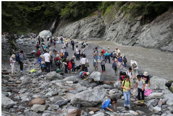
■糸魚川ー静岡構造線断層を川岸で見学