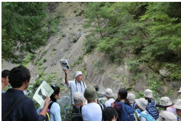
■新倉断層 フォッサマグナの西端の断層