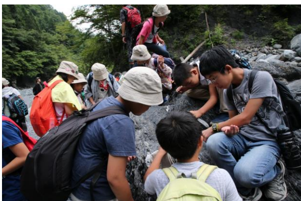
■粘板岩や石英を採取