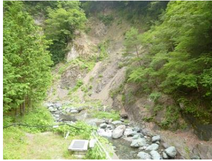
⑥フォッサマグナのガケ