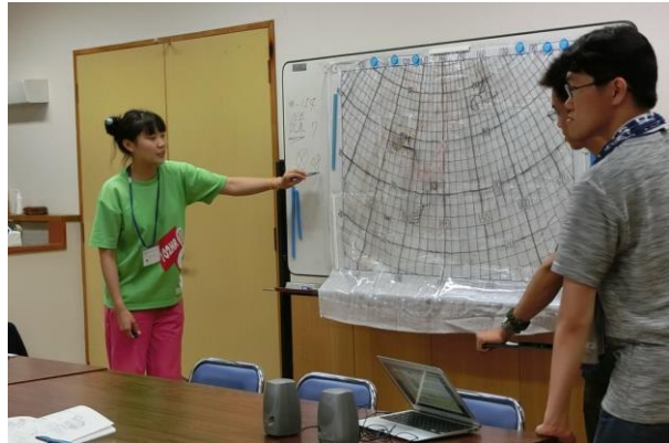
■ 天気図の解説 いそぎんちゃくの出番