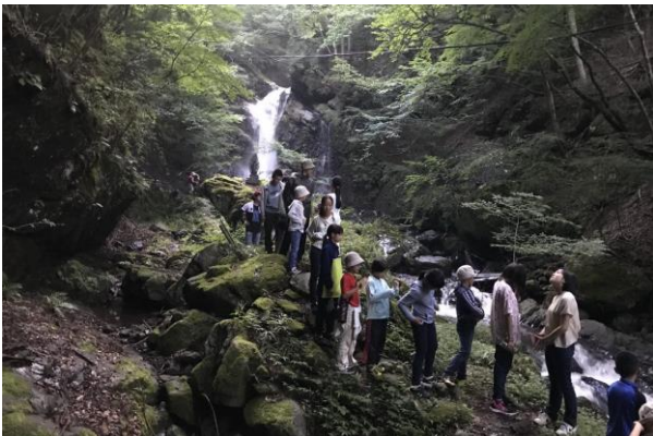
■ 3日目朝の早朝散歩