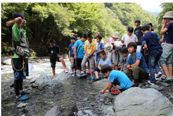
■研究員の方から水生昆虫の説明を受ける