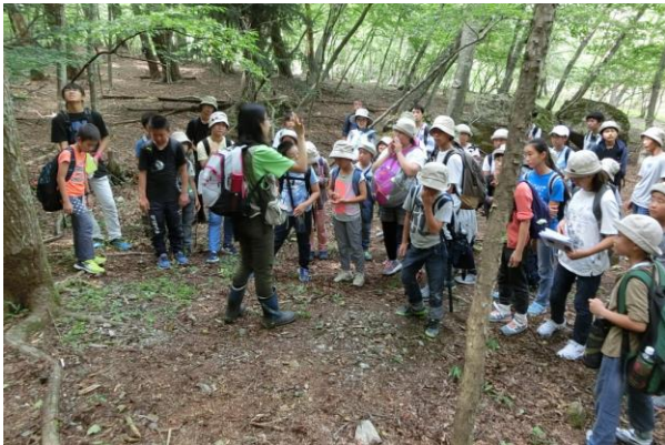
■ 午後は生き物の暮らしオリエンテーリング