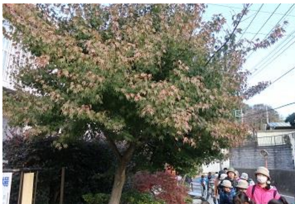
■舞岡駅から舞岡公園まで歩く