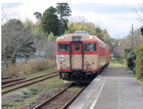
いすみ鐵道の急行