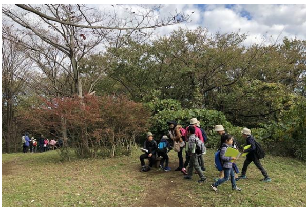
■ハイキング日和でした