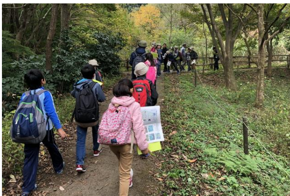
■テキストをたよりに班で歩く