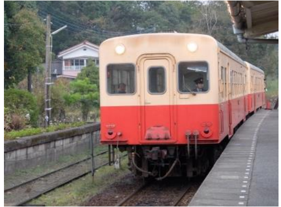
小湊鐵道 (こみなとてつどう)