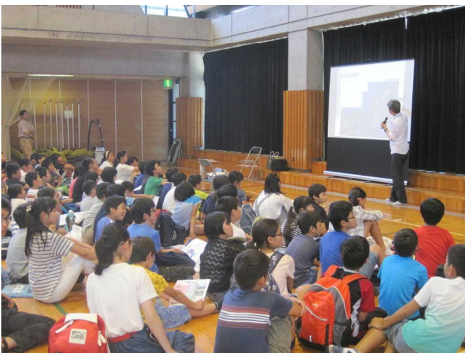
■夏季活動の説明です。明治公民館の体育室をお借りして行いました。ここは冷房がないので暑かったね！