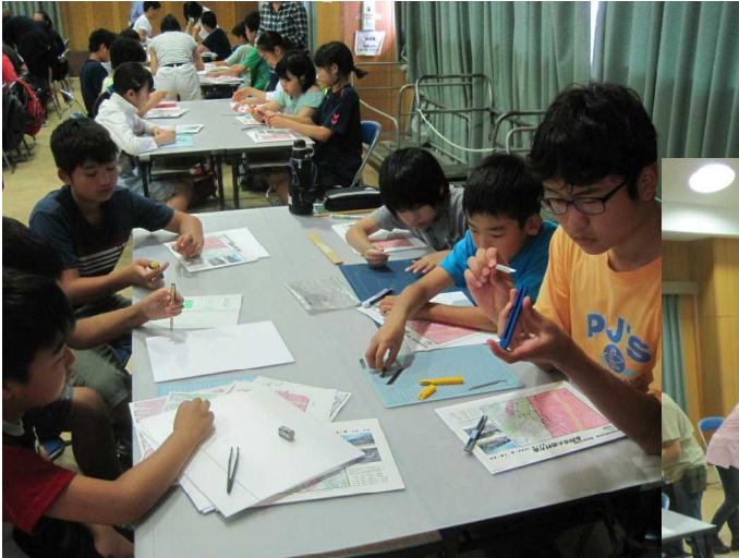
■頑張って作りました。大鹿の地形の特徴がわかりましたか？