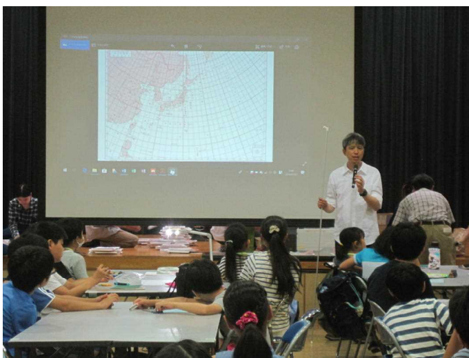
■立体模型作成の前の天気図のお話。今年の天気図教室が「地獄！」になることは、このときはまだ誰も知る由もなく、・・・。