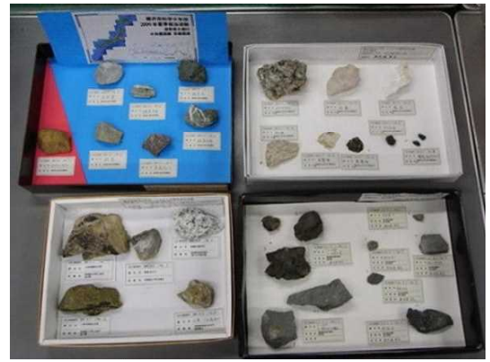
■過去に作成した標本箱（例）

作製した標本箱は、できれば水平のまま持ち帰りたいので、マチの広い紙袋や買い物袋が用意できれば持参してください。