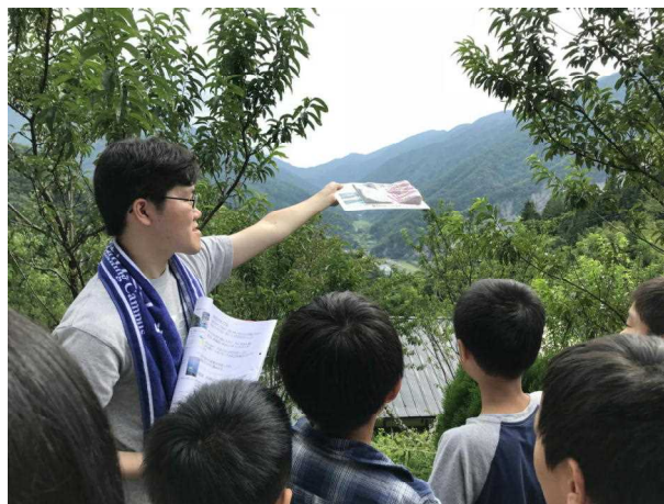
■中尾峠で地形模型と見比べる

さて、9月活動は夏季活動で学んだことを振り返り、発展させるための活動です。夏季活動に参加できていなくても、9月活動に参加することで同じテーマの体験が少しできると思います。