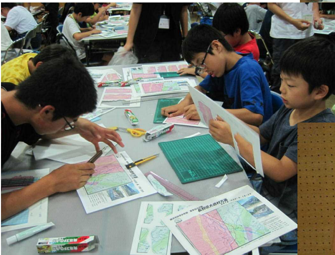
■今年は簡単だったのかな？本当はお家の人の分をとっておいてあげてほしかったんですが、時間内になんと55人が完成させてしまいました。